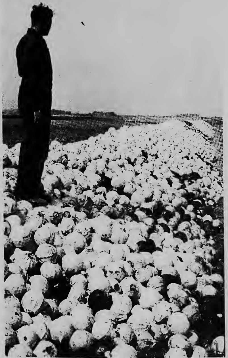
Miles di kolo, cria cu hopi trabao, awor ta drumi manera sushi banda di Warmenhuisen.